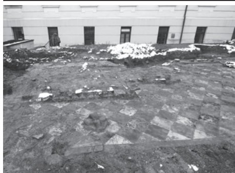
Odkryty fragment posadzki synagogi.

Jeżeli tylko warunki pogodowe na to pozwolą, w najbliższym tygodniu archeolodzy powinni zakończyć prace przy Gimnazjum nr 1.