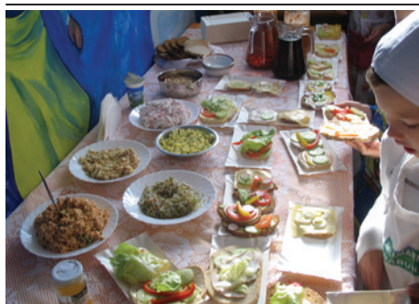
Zdrowe jedzenie to podstawa.

Szkoła Podstawowa nr 3 z Oddziałami Integracyjnymi wzięła udział w ogólnopolskim programie Śniadanie Daje Moc . Uczniowie uczestniczyli w licznych misjach śniadaniowych pełnych ciekawych zabaw, gier i eksperymentów, dzięki którym poznali zasady zdrowego odżywiania. „Pięć posiłków