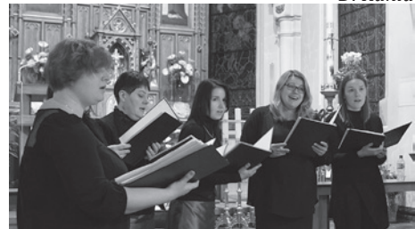
Zespół „Vocalis” działa od 1999 roku.