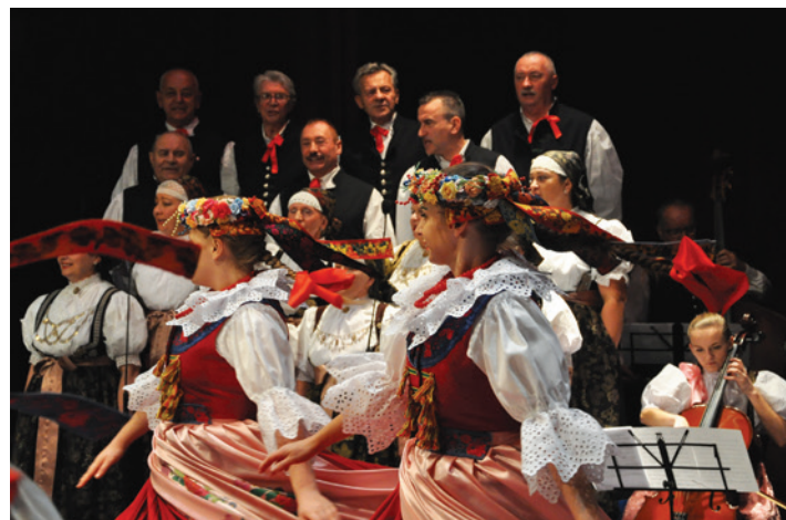
Na deskach teatru wystąpił Zespół Pieśni i Tańca Ziemi Cieszyńskiej im. Janiny Marcinkowej.