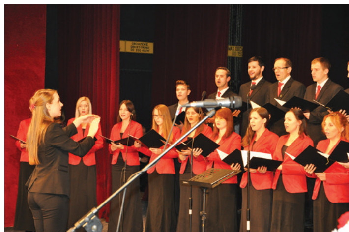
Gościnnie wystąpiły także orkiestra „Glorietta” z Jaworza oraz chór „Lutnia” (na zdjęciu) ze Strumienia.