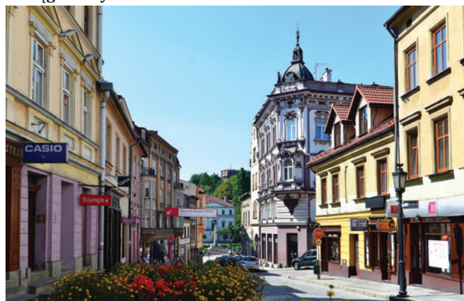
Ulica Głęboka w Cieszynie.