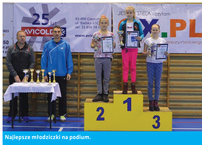
Najlepsze młodziczki na podium.