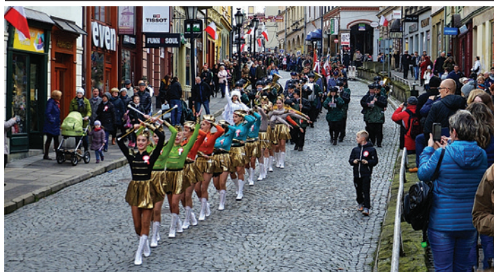
Tradycyjnie w obchodach 11 listopada uczestniczyło dużo mieszkańców.