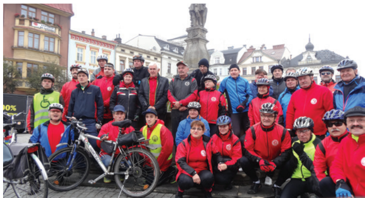
„Ondraszki” prezentują się zawsze okazale.

Na jubileuszowy, 50. sezon kolarski zarząd klubu wraz z bratnią Sekcją Turystyki Rowerowej Olza przy Polskim Towarzystwie Turystyczno-Sportowym Beskid Śląski w Republice Czeskiej przygotował sporo atrakcji w formie jedno- i wielodniowych rowerowych wycieczek w bliższe i dalsze okolice. Całe kalendarium propozycji zostało opublikowane w specjalnym kalendarzyku, który od 2007 roku zostaje rozdawany wśród członków obu organizacji, a każda wycieczka była szczegółowo anonsowana na klubowej stronie internetowej, Facebooku, w Wiadomościach Ratuszowych , a często także w lokalnej prasie po obu stronach Olzy.