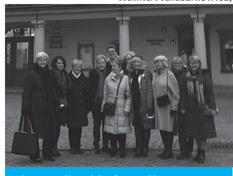
Połączone siły polsko-francuskie...