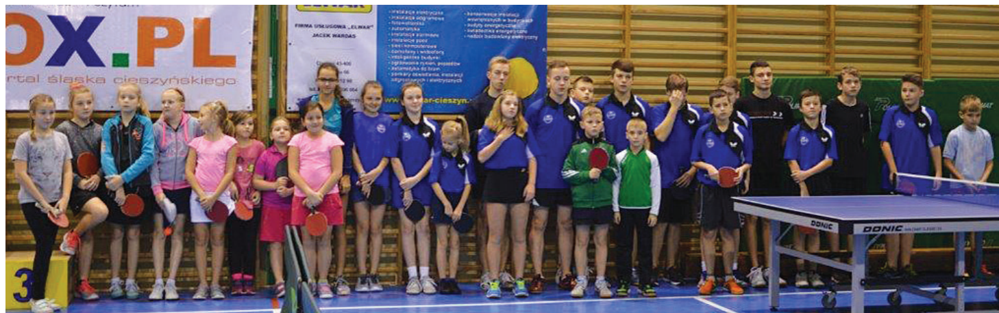
Łącznie rywalizowało 27 zawodników w czterech kategoriach wiekowych.