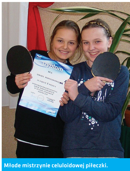
Młode mistrzyni celuloidowej piłeczki.